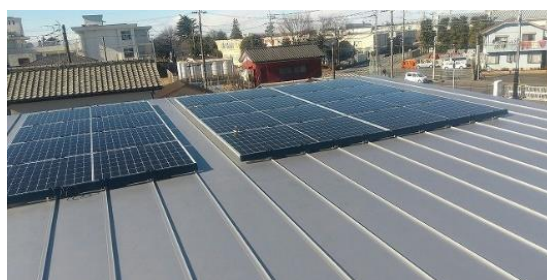
のだのこども園の「そらべあ発電所」太陽光パネル