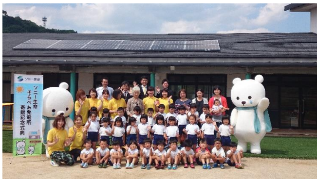
寄贈記念式典のイメージ(写真は他園です)