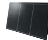
CIGS 太陽電池の概観は、シックな黒色のため、日本家屋の屋根にもマッチするなどデザイン性に優れている

上げの一部を、そらべあ基金に寄付するプロジェクトがあるということを知りました。その話に共感した我々は、そらべあ基金でCIGS太陽電池を活用していただければ、多くの人たちに、太陽電池が地球温暖化防止に貢献できることを伝えるきっかけになると考え、「そらべあスマイルプロジェクト」に協力させていただきました。ホンダの想いが詰まった太陽電池、ソニーの環境保全にかける想い、そして子どもたちの未来を守ろうというそらべあ基金の想い。三者の「想い」がうまく合致したというわけです。