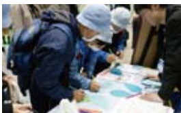
涙型のカードに エコアクションを書く子どもたち